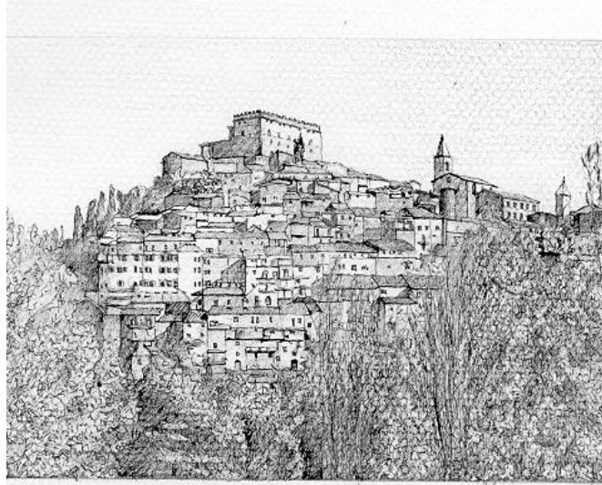
Veduta panoramica del paese

Seguì la podestà degli Altemps e nel 1700 succedettero gli Albani che, sotto il pontificato di Innocenzo XIII, nel 1724 ebbero mutato in Principato il possedimento di Soriano. Alessandro Albani portò a compimento la costruzione del palazzo di Papacqua e ospitò nel castello Giacomo Eduardo Francesco, figlio di Giacomo II, detto il Cavaliere di S.Giorgio, erede al trono di Inghilterra con il nome di Giacomo III. Gli Albani realizzarono anche l'espansione urbana di Soriano e aprirono due Porte di accesso, una in Via Benedetto Brin, detta Porta Romana, e l'altra in Via Splendiano Pennazzi, fecero inoltre costruire la Chiesa Collegiata, dedicata a S.Nicola di Bari patrono del paese. Gli Albani governarono il Castello e l'abitato di Soriano fino alla morte di Filippo Albani avvenuta nel 1852, quando gli eredi lasciarono la proprietà alla Santa Sede. Il castello fu trasformato in penitenziario e tale rimase anche dopo l'unità d'Italia, quando passò in proprietà al Regno. Utilizzato come penitenziario dal 1946, anche dallo Stato Italiano, fino al 1989 quando passò in proprietà del Ministero delle Finanze in quanto bene demaniale. E' a questo Ministero che l'Amministrazione Comunale di Soriano ha chiesto recentemente l'uso.