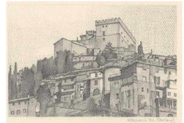
Veduta a nord del castello e di una parte del paese

Intorno al castello sorge l'antico borgo medievale, ancora in buono stato, con stretti vicoli e vie intersecatesi nella irregolarità planimetrica.